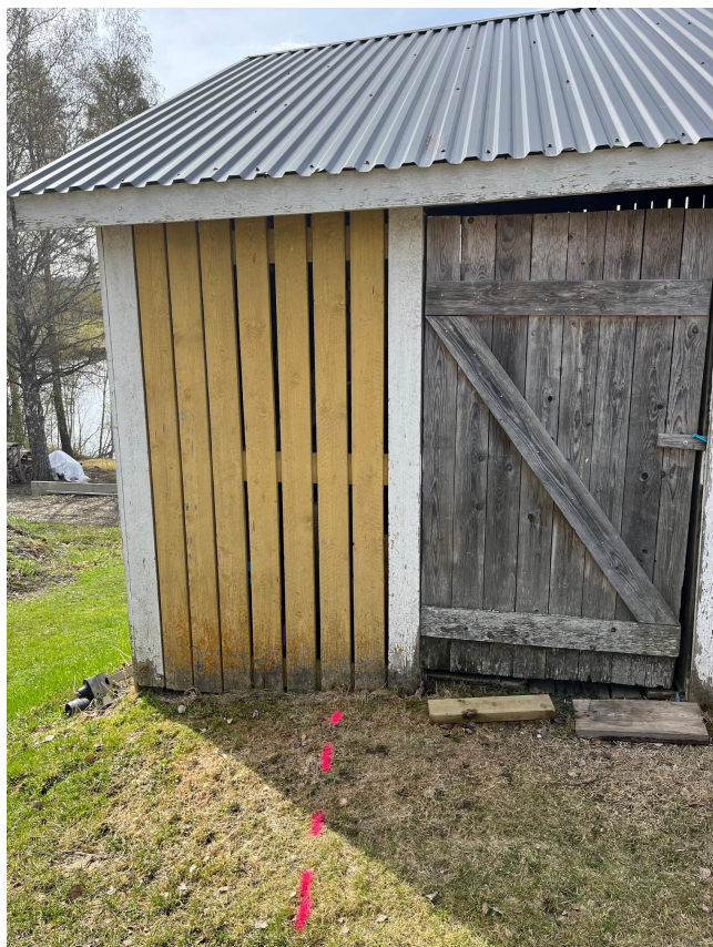
Byggnad (rosa linje markerar tomgräns mellan fastigheterna 4:76 och 4:94)