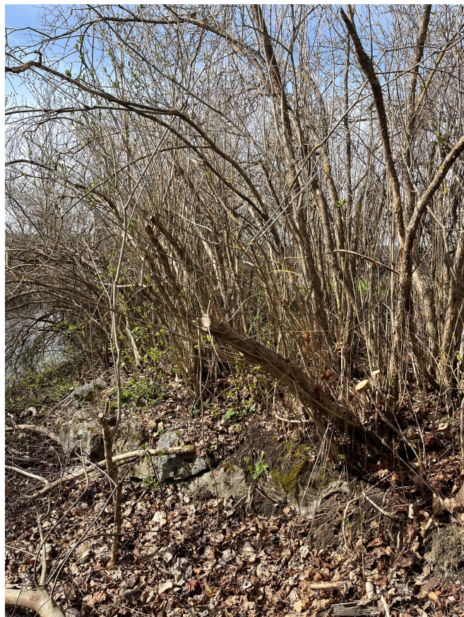
Stenmur med syrenhäck