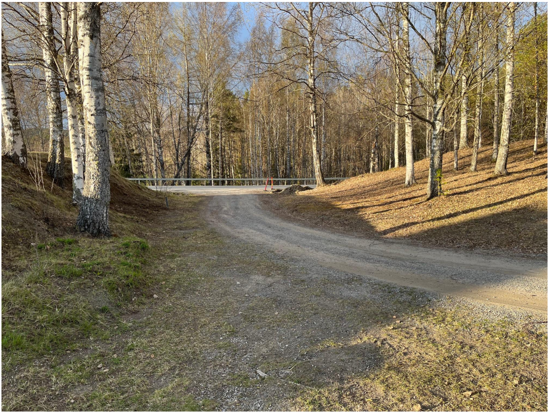
Grusväg på fastighet 4:76