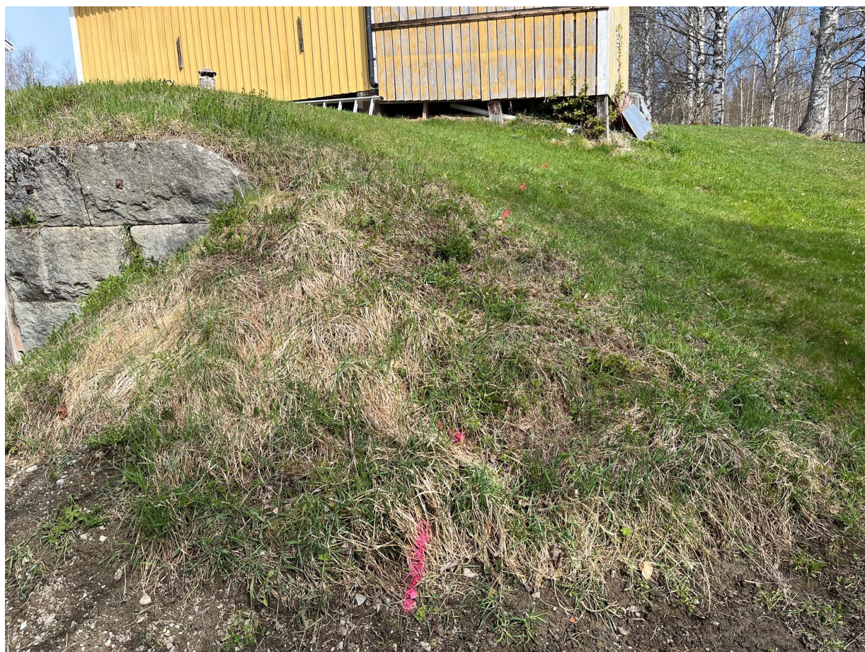
Jordkällare och byggnad (rosa linje markerar tomgräns mellan fastigheterna 4:76 och 4:94)