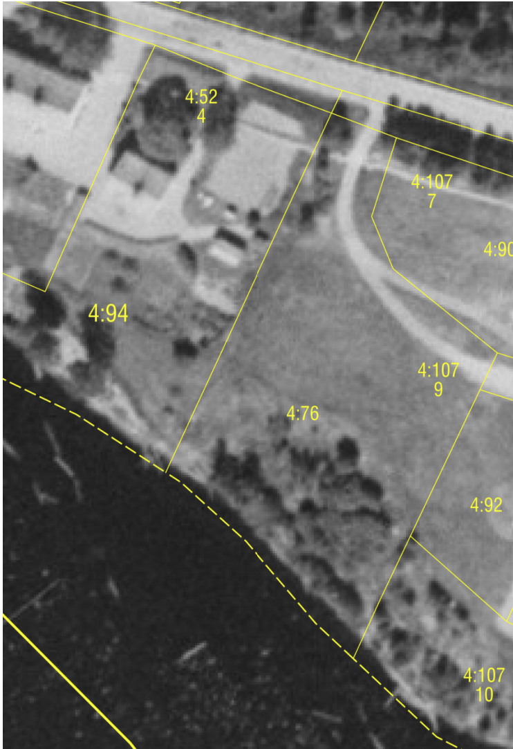
Flygfoto ca 1960